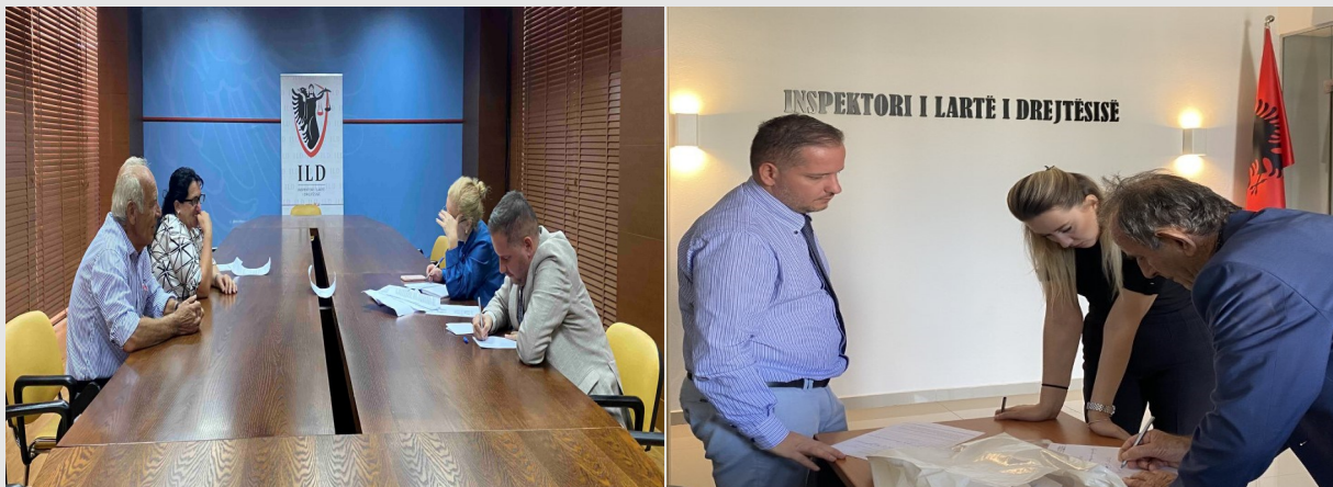
Gjatë asistimit të ankuesve

Komunikimi me qytetarët është pjesë e punës së përditshme të Inspektorit të Lartë të Drejtësisë. Sektori i ankesave në ILD është përgjegjës për garantimin e të drejtës së informimit të qytetarëve dhe transparencën ndaj publikut. Ky sektor ndjek gjurmueshmërinë e ankesave në sistem dhe jep përgjigje për ankuesit, mbi fazën ku ndodhet ankesa e tyre.