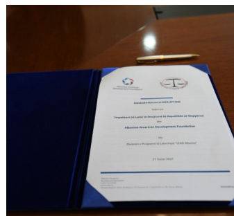
Memorandumi i mirëkuptimit

Një memorandum mirëkuptimi u nënshkrua mes Zyrës së Inspektorit të Lartë të Drejtësisë dhe Fondacionit Shqiptaro-Amerikan për Zhvillim (AADF) për Programin për zhvillimin e lidershit LEAD Albania. Ky program synon t'u sigurojë profesionistëve të rinj dhe të talentuar shqiptarë përvoja të drejtpërdrejta në procesin e qeverisjes së Shqipërisë.